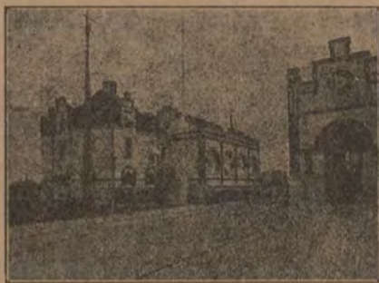
— NORRKÖPINGS ELEKTRICITETSVERK —