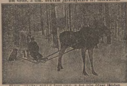
Elgen »Stolta» röda 6 Juni 1906, 6 fot hög öfver länden.