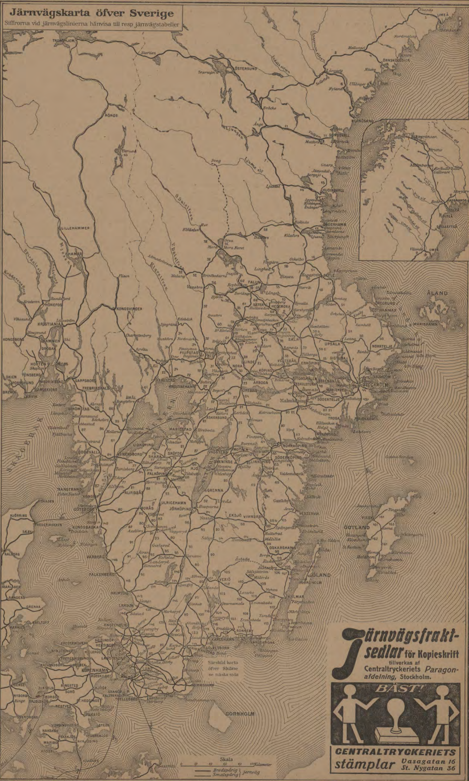
Järnvägskarta öfver Sverige Siffrorna vid järnvägslinierna hänvisa till resp järnvägstabeller

HAGA mineralvattenfabrik R. T. 27 45. A. T. 6 08.