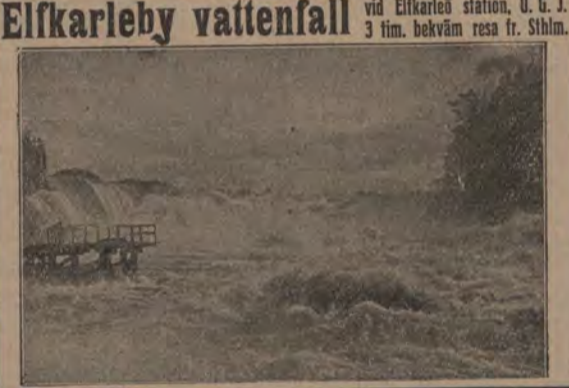
Elfkarleby vattenfall vid Elfkarleby station, U. G. J. 3 tim. bekväm resa fr. Sthlm.