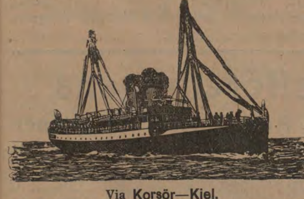
Via Korsör—Kiel. Två förbindelser dagligen i hvardera riktningen medelst 'Danska Statsbanornas ångare (natfart)'