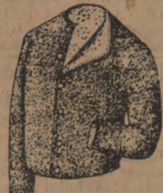
Såmskinnvästar med och utan ärmar Herr- från 8 till 25 st., Dam- från 5 kr. OBS! Stort urval Skinnkläder.