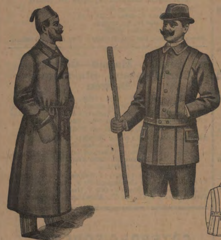
Morgonrockar från 18 kr. Kavajer från 15 kr.