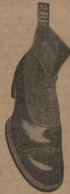
Amerikanska Skodon Malm Morgtgatan 3.