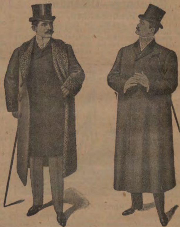
Promenad-Pälsar från 95 till 450 kr. Promenad-Ulstrar o. Paletåer från 30 till 115 kr. på lager.