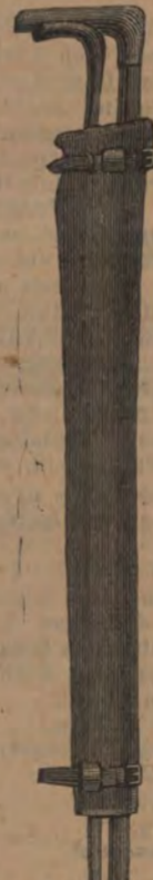
Engelska res-effekter på lager. Malm Morgtgatan 3.