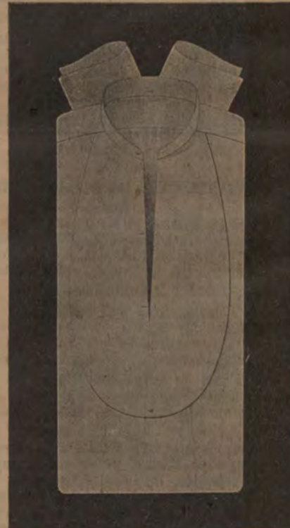
Förstklassiga skjortor, hvita och ku- lörtta, på lager och beställning. Finaste Berliner-Kragar på lager. (Malm Morgtgatan 3).