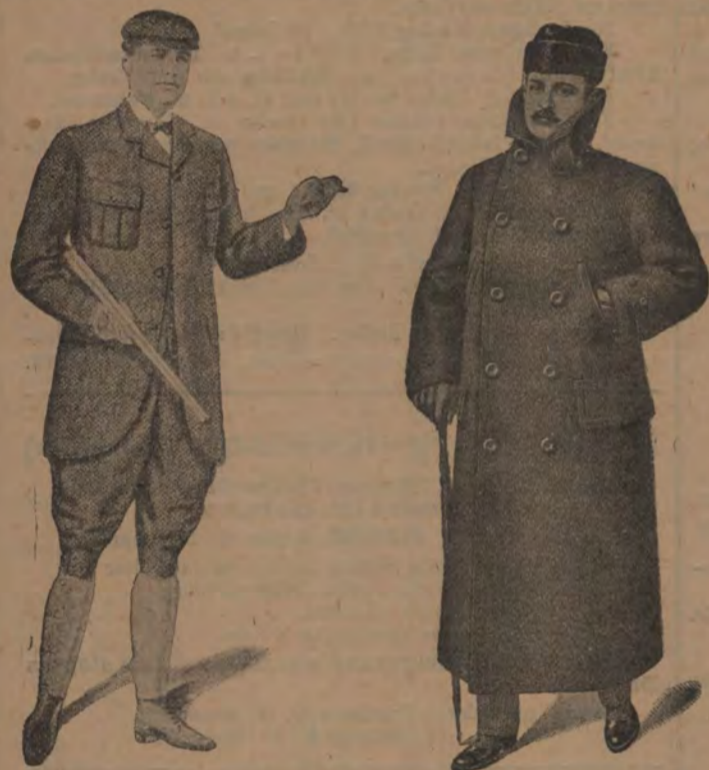
Resultstrar från 28 till 100 kr. Skinnmössor för militär och civil. Sportkostymer, alla slag, från 22 till 150 kr.

Udgivet af V. Malling, Fuldmægtig i Generaldirektoratet for Postvæsenet. Pris 1 Krone 50 öre pr Hefte; ved Abonnement 2 Kroner saarlig. Enkelte Exemplarer erholdes i Bogladerne og paa Jernbane- stationer. Annonser optages.