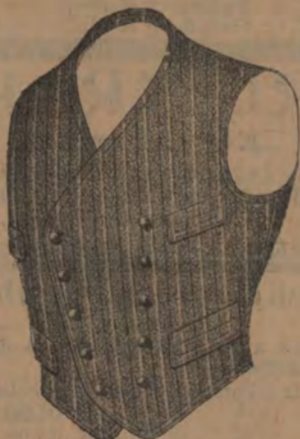
Kulörta o. hvita västar från 5 till 25 kr. st.