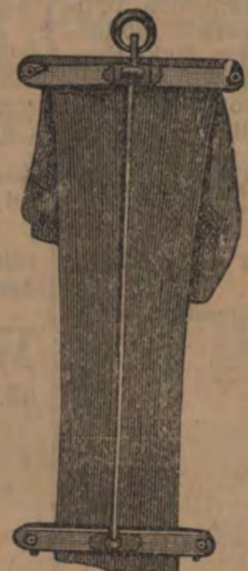
Byxor från 5 till 22 kr. Byxsträckare 7 kr.