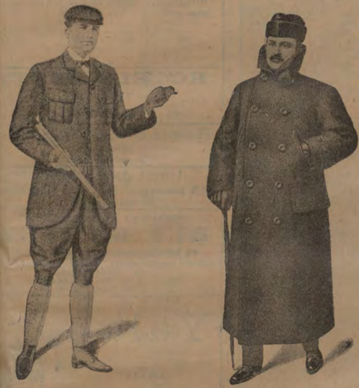
Resultstrar från 28 till 100 kr. Skinnmössor för militär och civil. Sportkostymer, alla slag, från 22 till 150 kr.