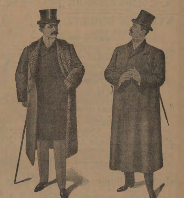
Promenad-Pälsar från 95 till 450 kr. Promenad-Ulstrar o. Paletåer från 30 till 115 kr. på lager.