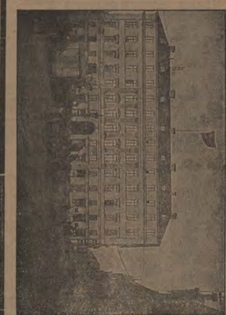
Brånkebergstorg 2 och Teletorner.

J. E. SANDBERG. Stor specialaffär af Sport-, Höglids- & Resdräkter. Regn- & Öfverplagg, Engelska och Skotska Tyger. 2 Brånkebergstorg 2. STOCKHOLM.