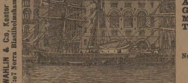
WAHLIN & Co. Kontor och Magasiner N:o 7 Norra Blasiholmshamnen, Stockholm.

Telegrafadress: WAHLIN Comp., Stockholm.