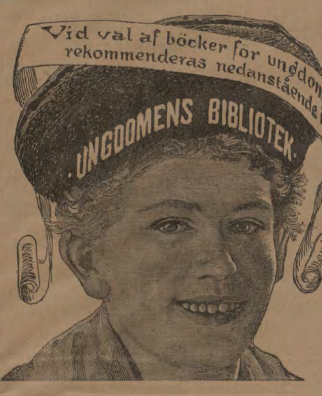
Adolf Johnssons förlag, Stockholm: