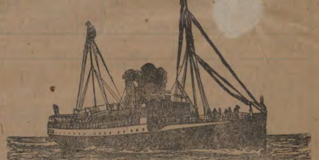
Postångbåtsförbindelse via Köpenhamn Korsör—Kiel Gjedser-Warmemünde.

Text describing short, peaceful, and pleasant travel options, including direct routes and services.