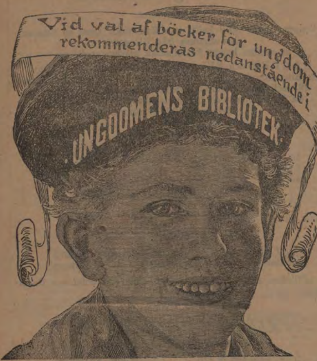
Adolf Johnssons förlag, Stockholm.