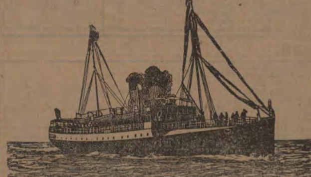
Postångbåtsförbindelse via Köpenhamn Korsör—Kiel Gjedser-Warnemünde

Fr. Frankfurt a/M 6,5 f. m. till Berlin ..... 1,30 e. m. > Cassel ..... 10 > till Lybeck ..... 5,00 >