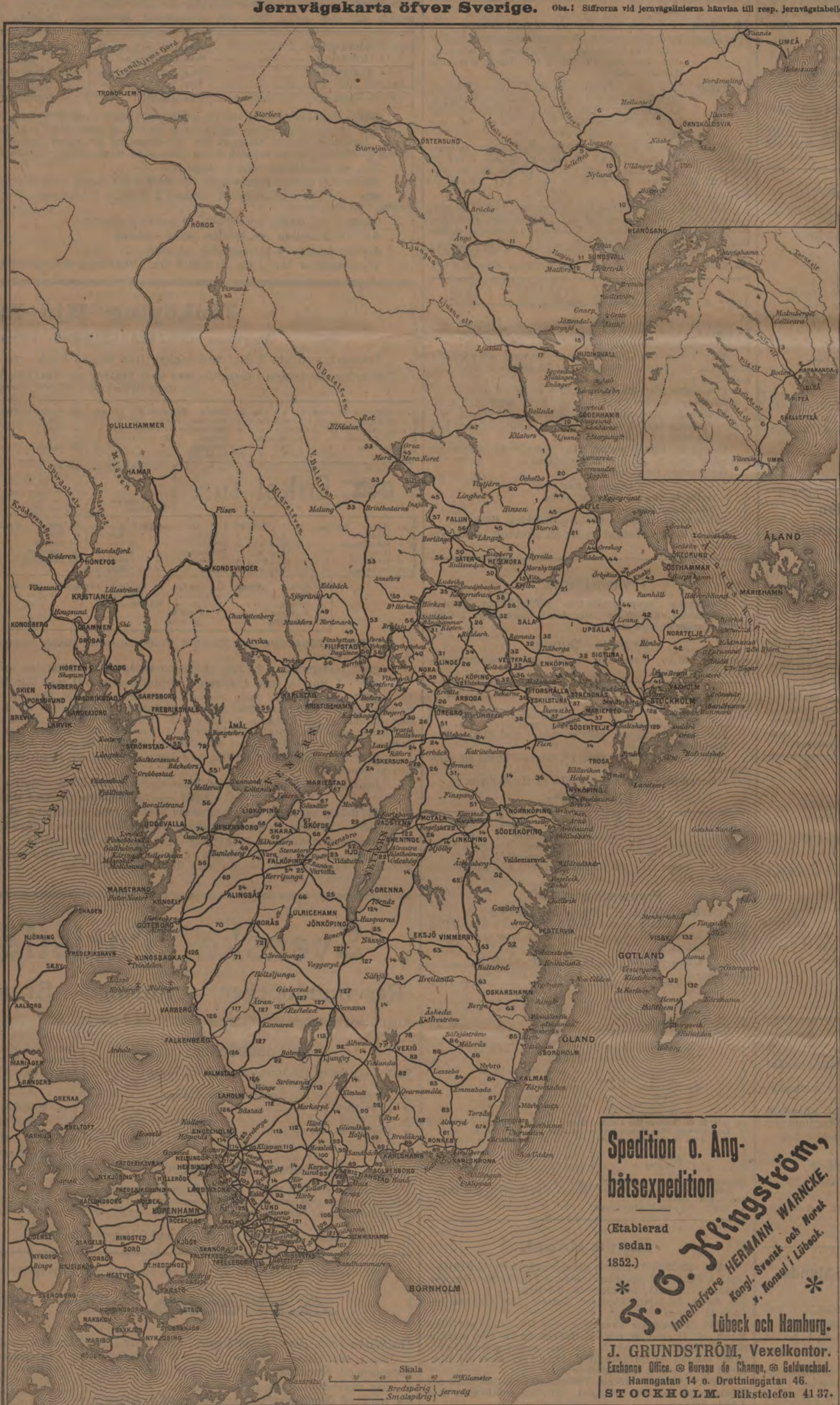
Jernvägskarta öfver Sverige. Obs! Siffrorna vid jernvägslinjerna hänvisa till resp. Jernvägstabeller.