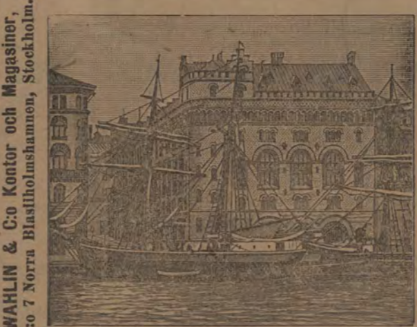
WAHLIN & Co Kontor och Magasin, N:o 7 Norra Blasiholmshamnen, Stockholm.

Skåne och Köpenhamn. Illustrerad handbok för re-sande. Med 7 kartor och 47 illustr. Inb. 2 kr.