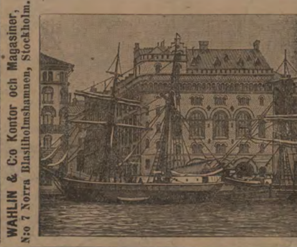
WAHLIN & Co Kontor och Magasin, No: 7 Norra Basillholmshamnen, Stockholm.

Norra Basillholmshamnen 7, hörnet af Nya Teatergatan STOCKHOLM. Telefoner: Allm. 75 96, Riks- 3 46. Telegrafadress: WAHLIN Comp., Stockholm.