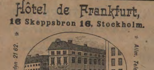
Hôtel de Frankfurt, 16 Skeppsbron 16, Stockholm.