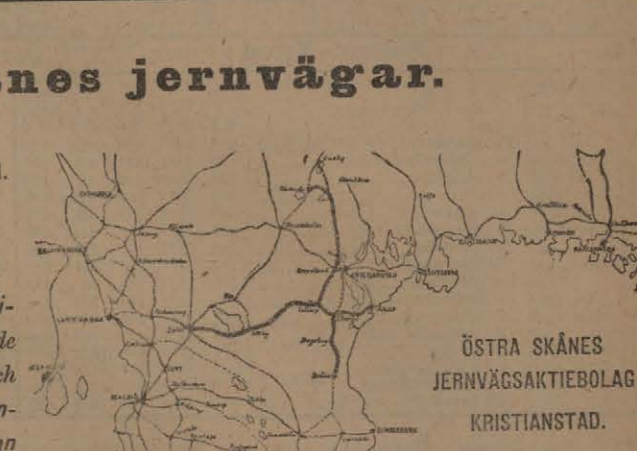
 stra Sk nes JERNV GSAKTIEBOLAG KRISTIANSTAD.

En bok om egna hem. Pa Alf Samuelssons f rl g ha i bokhandeln utkommit: Sommarg sten, sommaridyll. Pr. 1: 50. V gledning vid uppr ttandet af sm ttre bostadshus p  landet. V gledning vid uppr ttandet af sm ttre bostadshus p  landet. Pr. 1: 25. Att bygga ett eget hem. Pr. 1: 25. Att bygga ett eget hem. Pr. 1: 25. Att bygga ett eget hem. Pr. 1: 25.