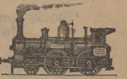
(G. 74, 537)