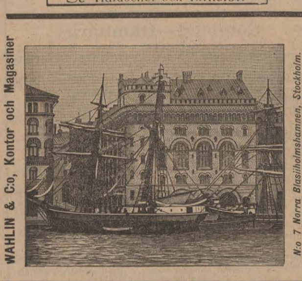
Wahlin & Co. Kontor och Magasiner No 7 Norra Blasieholmshamnen, Stockholm.

Höganäs Sten, Rör och Lerkärl, Stabbarps högelfasta Tegel, Lomma, Ölands o. Visby Portland Cement, Munksjö Asfalt- och Förhrydningspapp, Renad Trätjärna.