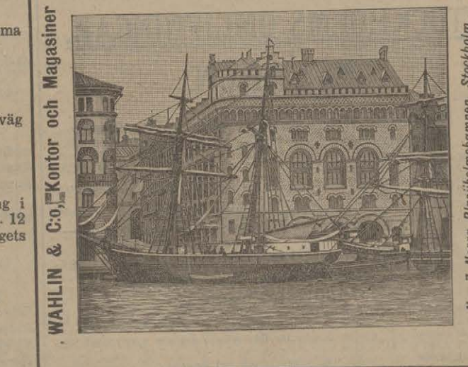
Wahlin & Co. Kontor och Magasin. N:o 7 Norra Blasieholmshamnen, Stockholm.

Ännu finnes i alla boklädor: Fru Kajsa Rulta och hennes katt..... 0: 60 Mormor Spitsnos och hennes hund..... 0: 60