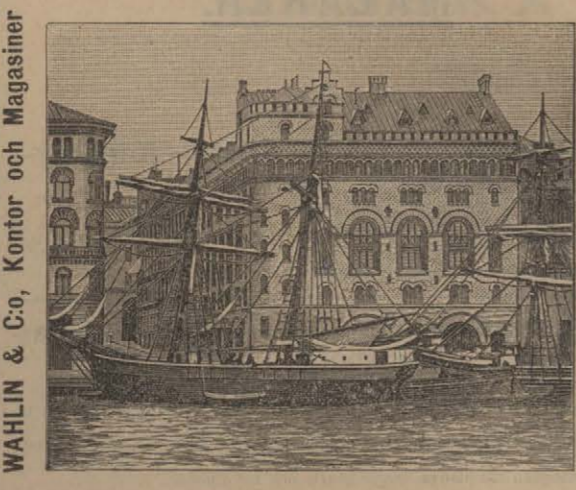
Wahlin & Co., Kontor och Magasiner No 7 Norra Blasieholmshamnen, Stockholm.