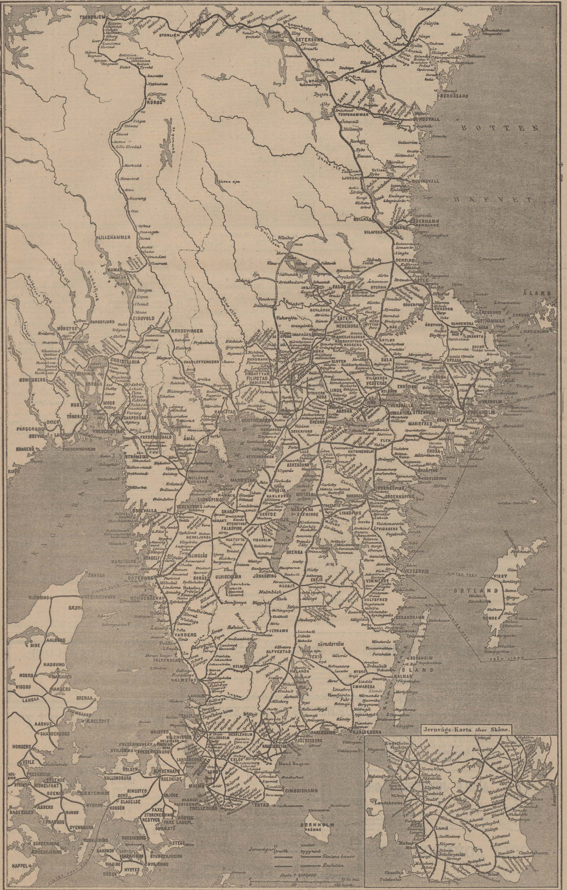
Jernvägs-Karta öfver Skåne.