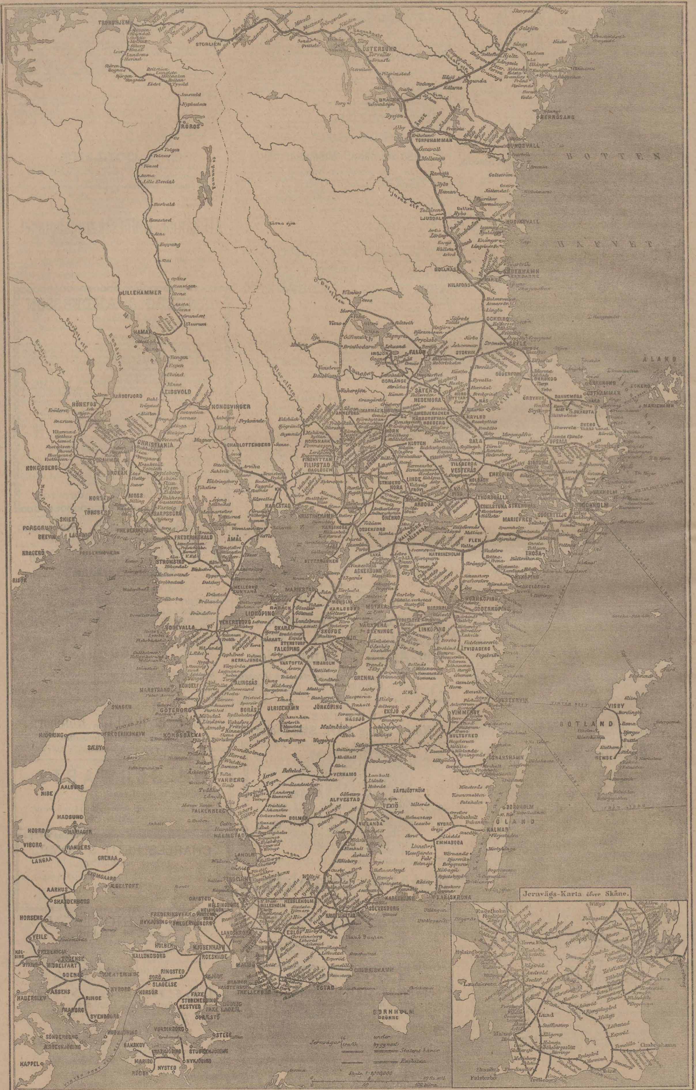
Jernvägs-Karta öfver Skåne.