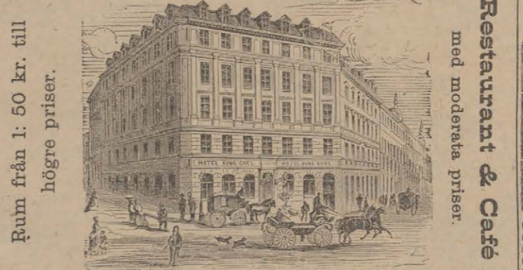
Rum från 1: 50 kr. till högre priser. med moderata priser. Restaurant & Cafe

Hotel de Frankfurt. Stockholm, N:o 16 Skeppsbron N:o 16. Detta vid Skeppsbron och Ångbåtarnes tillägningsplats välkända! och välbelägna Hotel tillhandahåller resande möblerade rum till billiga priser och rekommenderas i resandens benägna häkomst. Obs. Nyinreddt Café, rekommenderas i allt hvad till ett väl ordnat café hörer. Obs! Spårvagn passerar hotellet. Högaaktningfullt. C. Gustaf Jansson. Telefoner finnas.