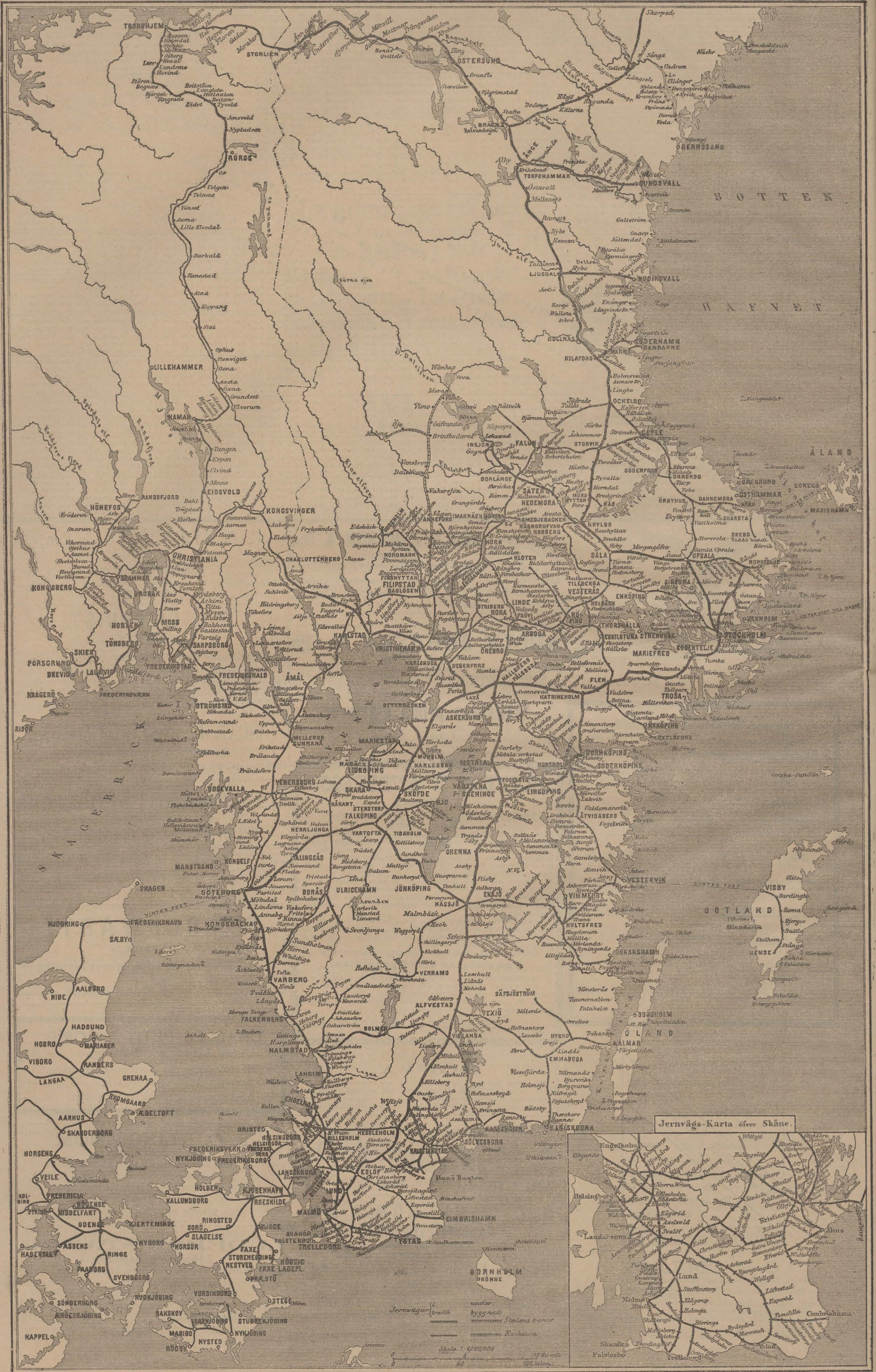
Jernvägs-Karta öfver Skåne.