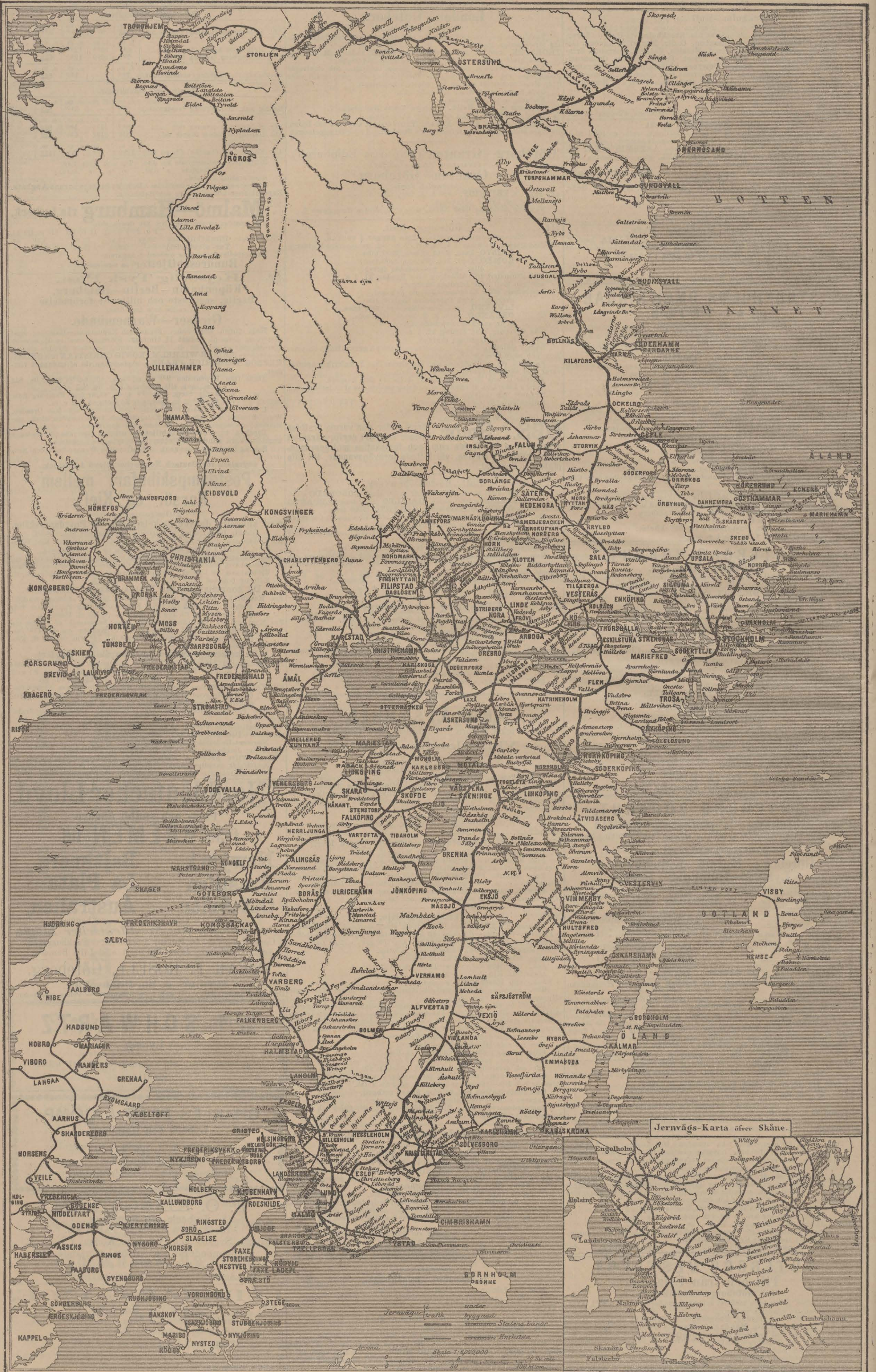
Jernvägs-Karta öfver Skåne.