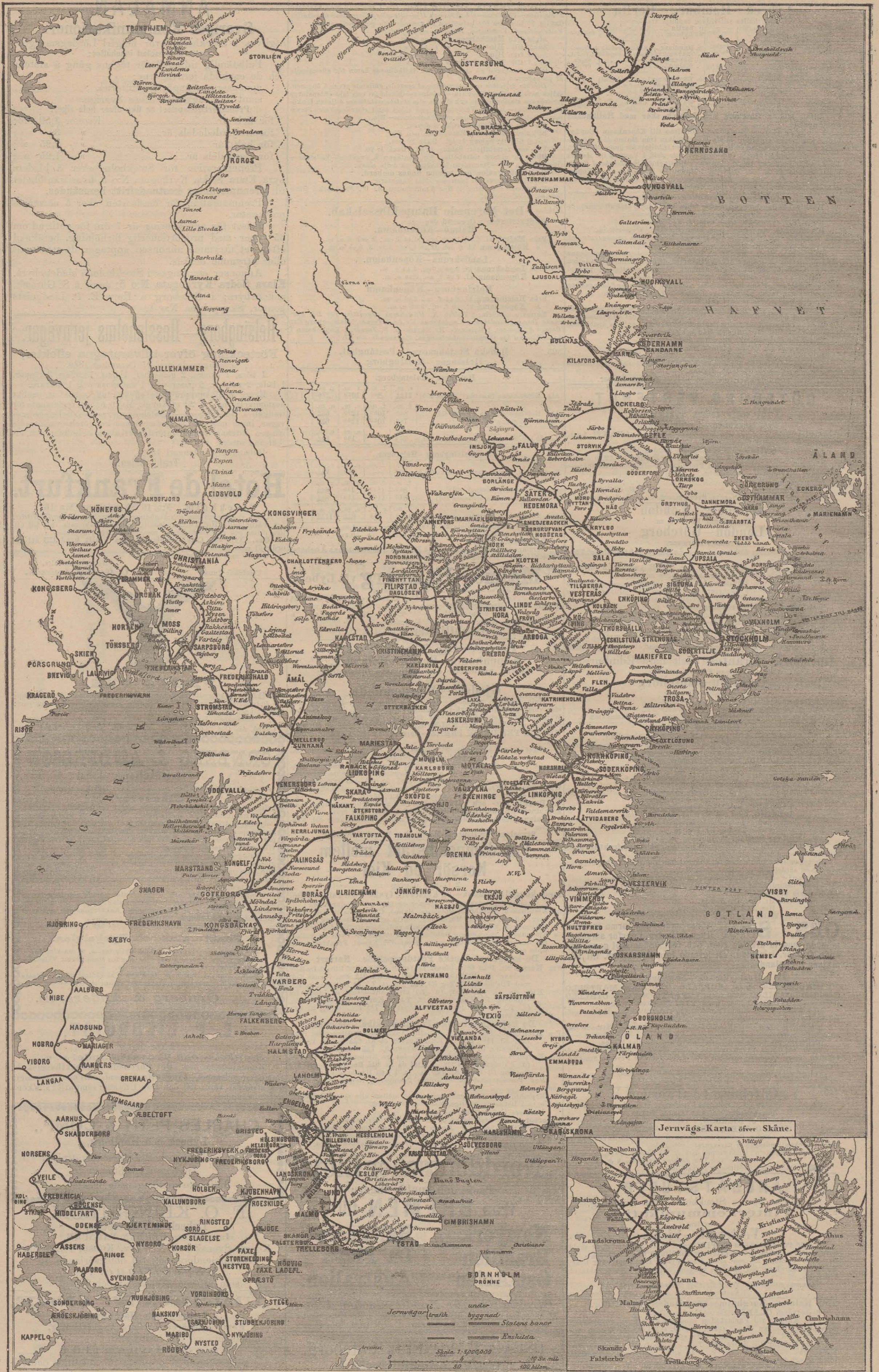
Jernvägs-Karta öfver Skåne.