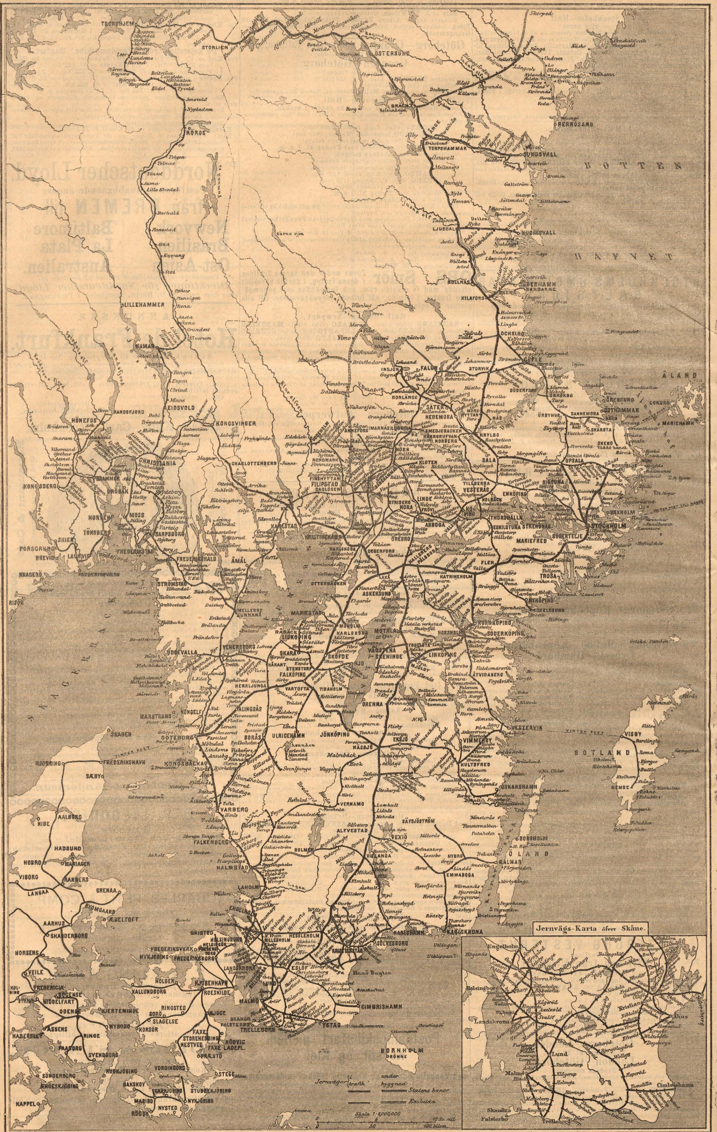
Jernvägs-Karta öfver Skåne.

Jernvägar byggnad Stators banor Enskilda