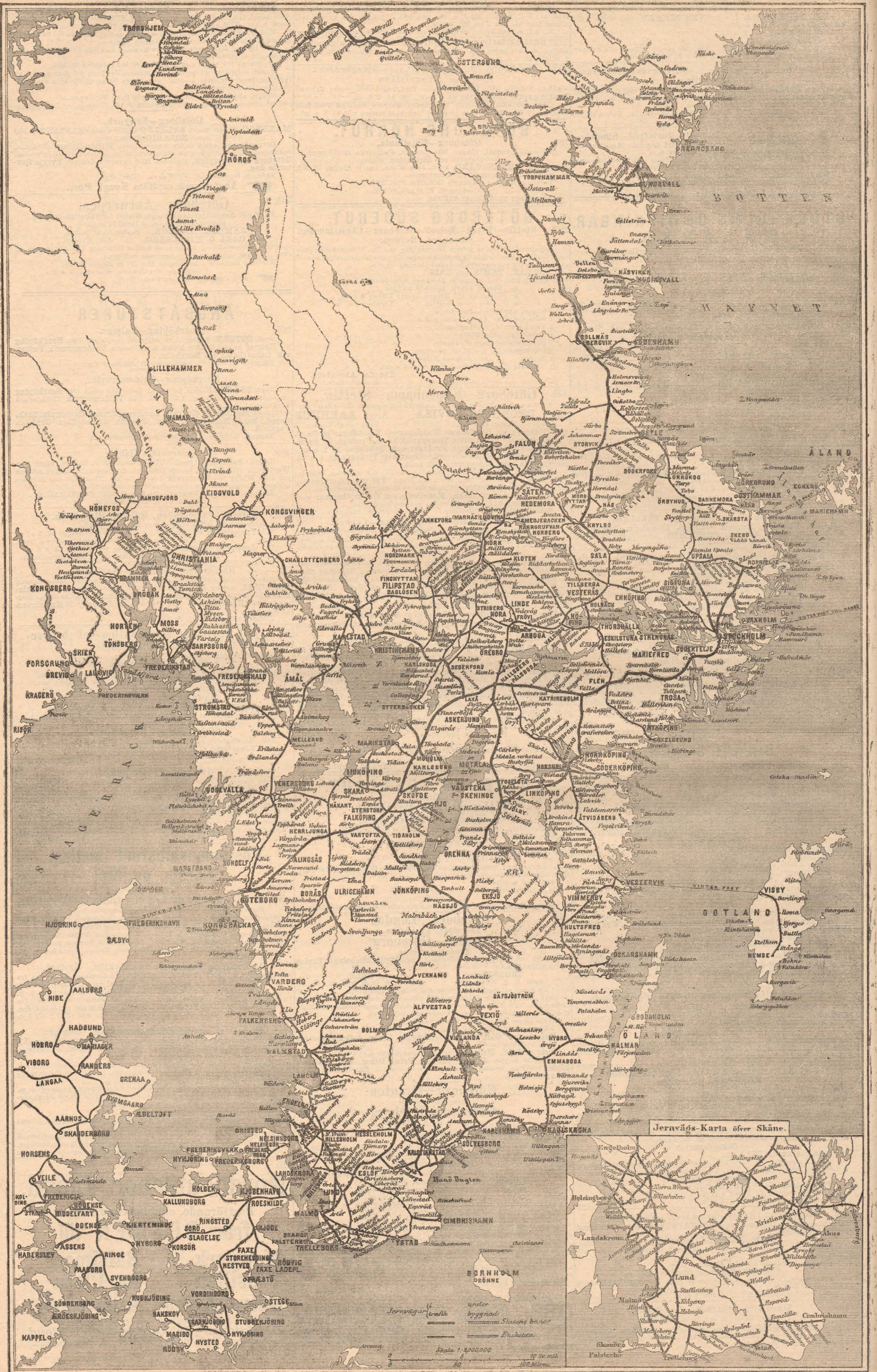
Jernvägs-Karta öfver Skåne.